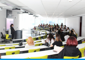
Üniversite Uyum Programı Gerçekleştirildi