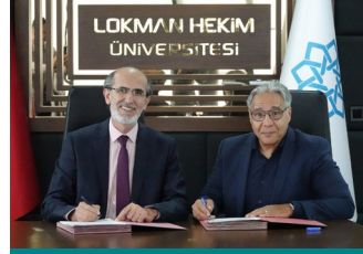
Lokman Hekim Üniversitesi ve Halal Correct Certification Arasında Protokol İmzalandı