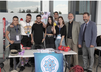
Öğrenci Toplulukları Tanıtımı Gerçekleştirildi