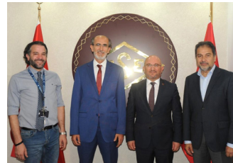
Rektörümüz TSE Başkanını Ziyaret Etti