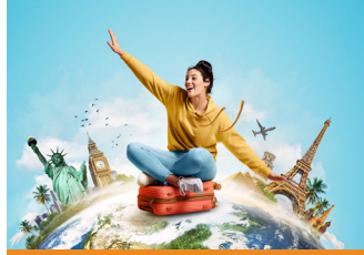
Üniversitemiz İlk Erasmus KA 171 Projesini Aldı